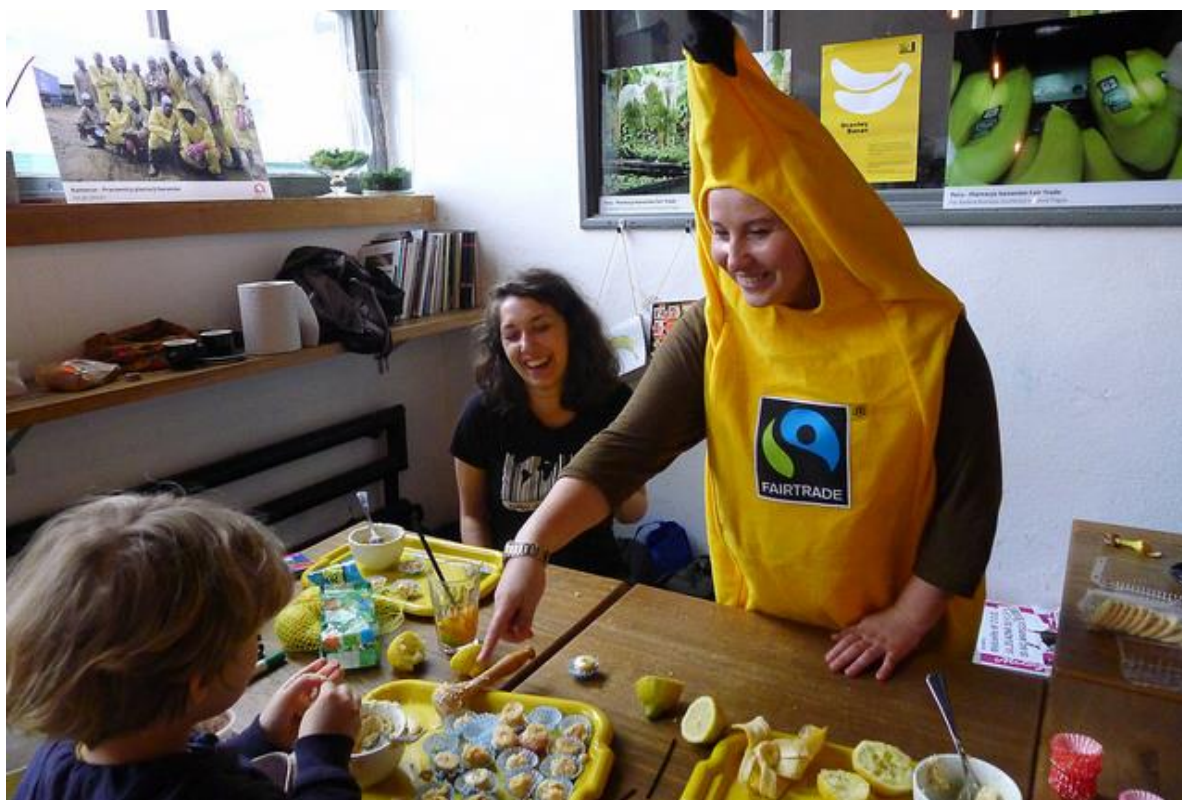
Warsztaty kulinarne dla dzieci podczas Majówki Fairtrade, Kraków 14.05.2016

W Międzynarodowym Dniu Sprawiedliwego Handlu 14 maja we współpracy z Fundacją Koalicja Sprawiedliwego Handlu – Fairtrade Polska, Fundacja Kupuj Odpowiedzialnie zorganizowała Majówkę Fairtrade . Majówka skierowana była do szerokiej publiczności, w szczególności do ludzi młodych oraz rodzin z dziećmi. Celem wydarzenia była promocja odpowiedzialnych wyborów konsumenckich związanych z konsumpcją owoców egzotycznych oraz kawy - produktów pochodzących z krajów Globalnego Południa. Majówka rozpoczęła się śniadaniem prasowym, w którym uczestniczyło 6 dziennikarzy i którym przekazany został pakiet informacyjny dotyczący tematyki wydarzenia i działalności Fundacji. W programie dnia znalazły się pokaz filmu „Bananas!” z polskimi napisami, prezentacje na temat certyfikaty Fairtrade oraz sprawiedliwego handlu, warsztaty kulinarne przy użyciu certyfikowanych produktów, zajęcia dla dzieci oraz koncert muzyczny na koniec dnia.