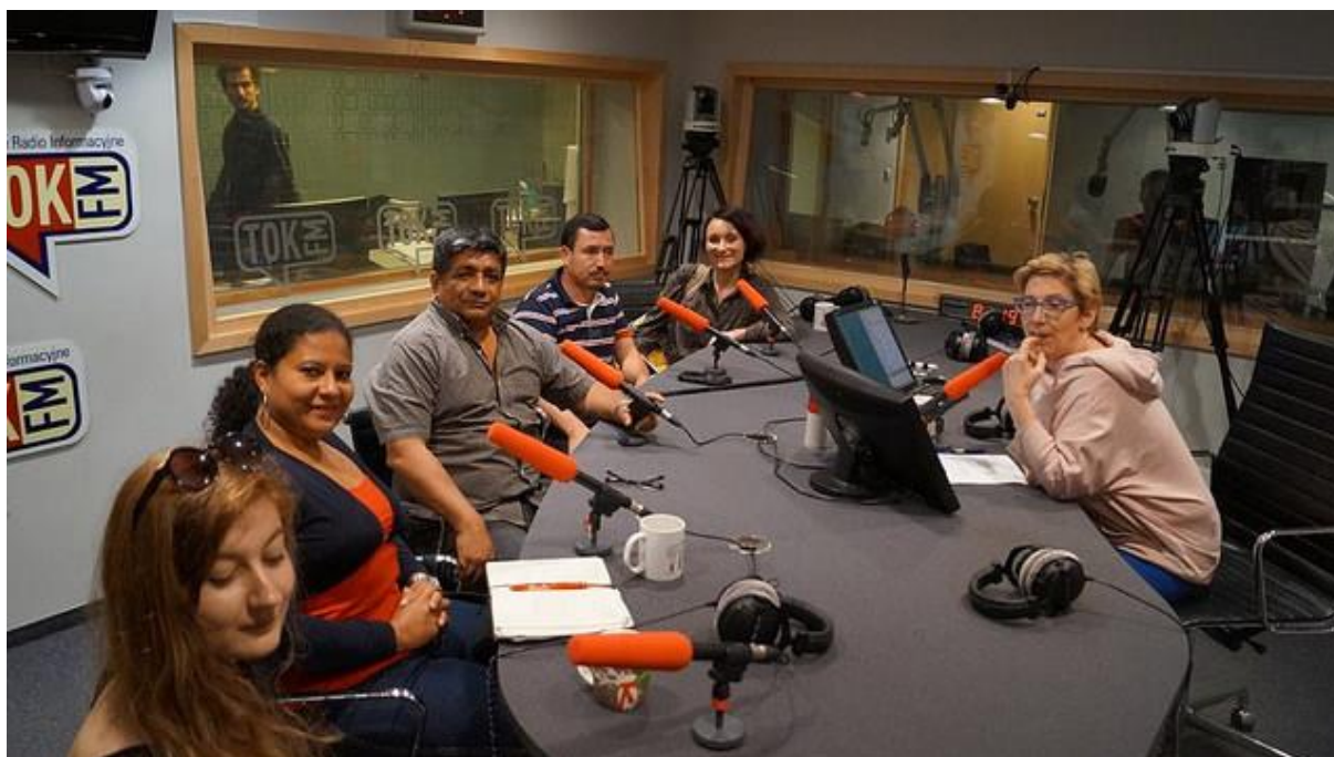
Wywiad ze związkowcami z Ekwadoru w Radio TOK FM, Warszawa, 18.06.2016

W 2016 r. Fundacja Kupuj Odpowiedzialnie zorganizowała także 3 debaty eksperckie poświęcone szeroko pojętej tematyce odpowiedzialnej konsumpcji i produkcji: