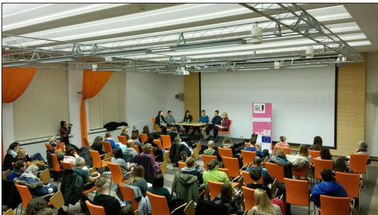
Pokaz filmu i debata w Kinie KC, Warszawa, 08.12.2016

Dodatkowo, aktywiści i eksperci Fundacji wzięli udział w warsztatach i wykładach poświęconych szeroko pojętej tematyce zrównoważonej produkcji i konsumpcji: