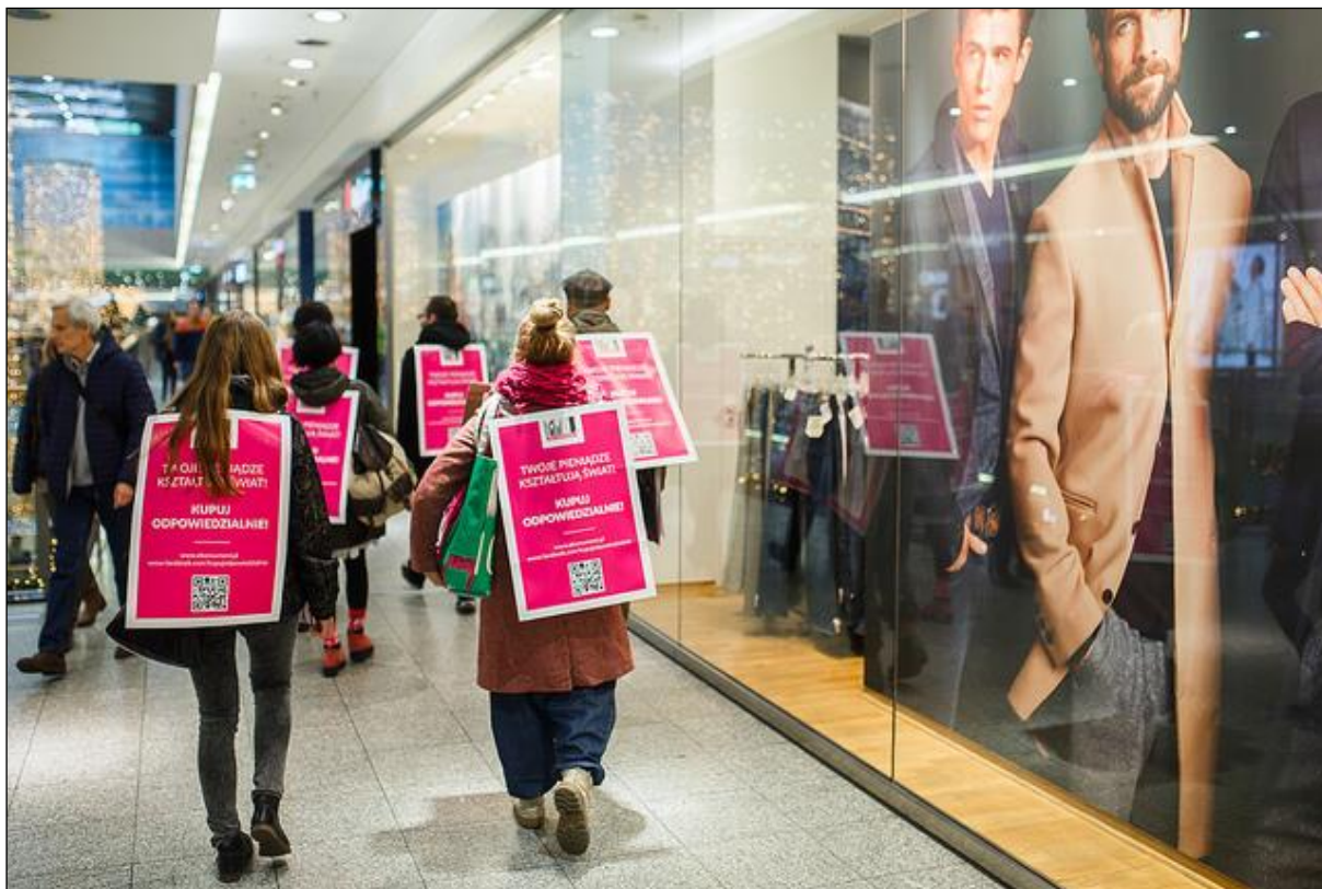
Dzień Bez Kupowania, Kraków, 29.11.2016