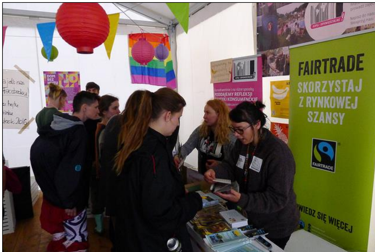
Stoisko Fundacji na festiwalu Woodstock, Kostrzyn, 14-16.07.2016

działania kampanijne oraz edukacyjne dotyczące odpowiedzialnej produkcji i konsumpcji - informowali, dystrybuowali materiały kampanijne, zachęcali do przyłączania się do aktualnych petycji/pilnych. Na obydwu wydarzeniach zorganizowano mini-warsztat odpowiedzialnej konsumpcji oraz grę dotyczącą tej tematyki, angażując czynnie około 500 osób i docierając do przeszło 3,5 tysiąca młodych ludzi.