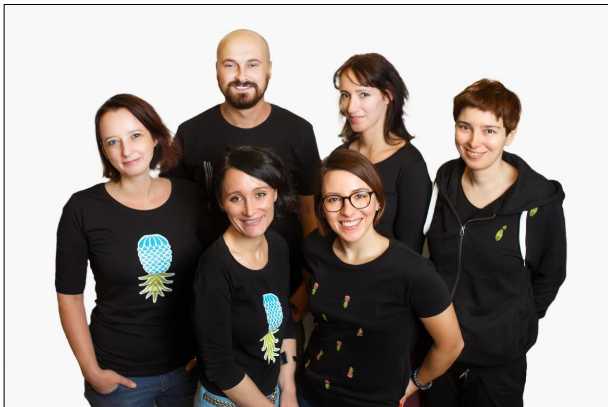
Zespół Fundacji Kupuj Odpowiedzialnie