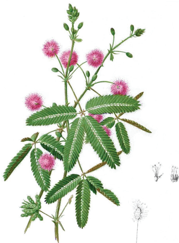
Fot. Mimoza, źródło: pl.wikipedia.org

Część garbarni w Europie wykorzystuje tego typu środki do garbowania skóry jako alternatywę do garbowania z użyciem chromu. Ta metoda jest wciąż doskonałona by była jak najbardziej ekologiczna i ekonomiczna.