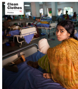
Odszkodowania potrzebne od zaraz

W kwietniu 2013 światem wstrząsnęła katastrofa fabryk zlokalizowanych w budynku Rana Plaza w Bangladeszu. Zginęło ponad 1134 osób, a wiele więcej zostało rannych. Zawalił się budynek mieszczący kilka fabryk odzieżowych szyjących dla znanych marek. To właśnie dzięki kampanii konsumenckiej udało się przekonać marki zlecające produkcję w niebezpiecznym budynku do wypłaty odszkodowań rannym i rodzinom ofiar. Zrobili to ludzie tacy jak Ty!